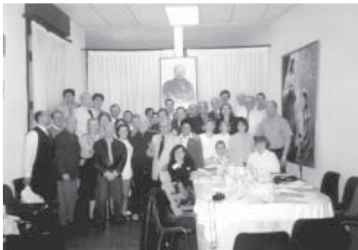
Grupo de los asistentes a las reuniones del C.E.I. Europa en el Centro de Estudios y Divulgación Espírita de Madrid, el día 4 de abril de 1999.

Fueron días de grata convivencia y trabajo que sirvieron para propiciar el