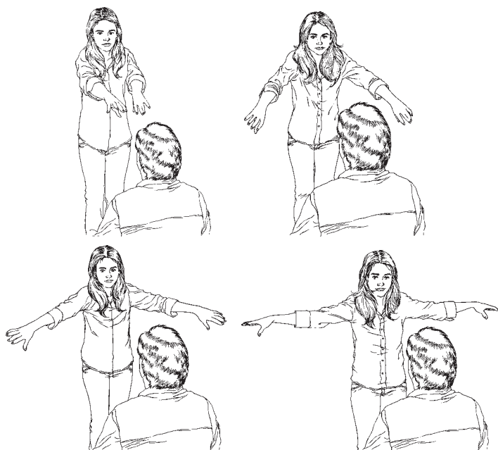
Figura 3: Pases transversales.