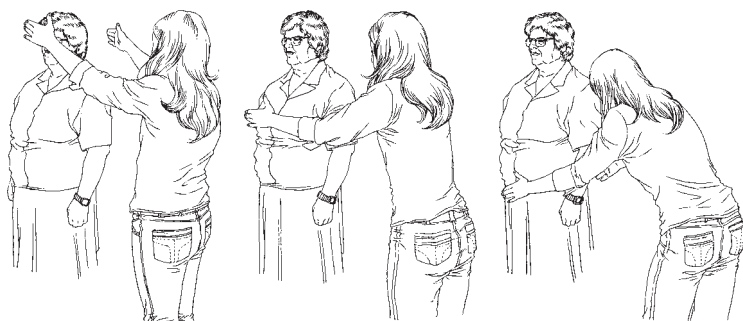
Figura 4: Pases perpendiculares - aplicación lateral.