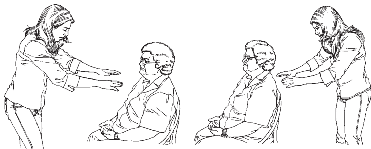
Figura 2: Pases longitudinales.

S ON LOS PASES REALIZADOS A LO LARGO DEL CUERPO O DE los miembros con una o ambas manos. Pueden ser aplicados también a lo largo de la columna vertebral, a partir de la nuca. Cuando son realizados a una distancia de más de 15 centímetros, reciben el nombre de pases de grandes corrientes y brindan al paciente sensación de bienestar y calma 86 .