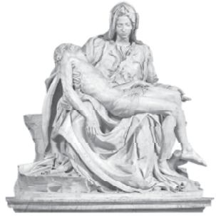
Pietà, celebre escultura de Miguel Ángel

En la noche del primero de diciembre de 1984, el espíritu Emmanuel dictó por intermedio